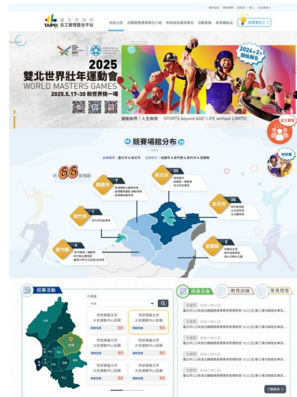
臺北市志工管理整合平台