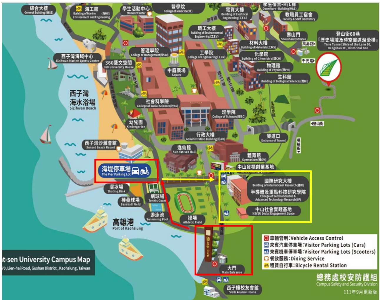
圖 1、海堤停車場與會場往返路線