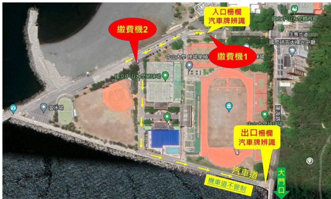
圖 2、海堤停車場繳費機位置