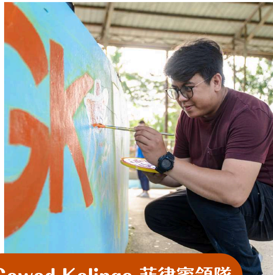
Gawad Kalinga 菲律賓領隊

梯隊將會有 2~3 名領隊 帶領 在出發前領隊也會 接受訓練 以應變現場各式狀況的發生 給予志工最大的助力