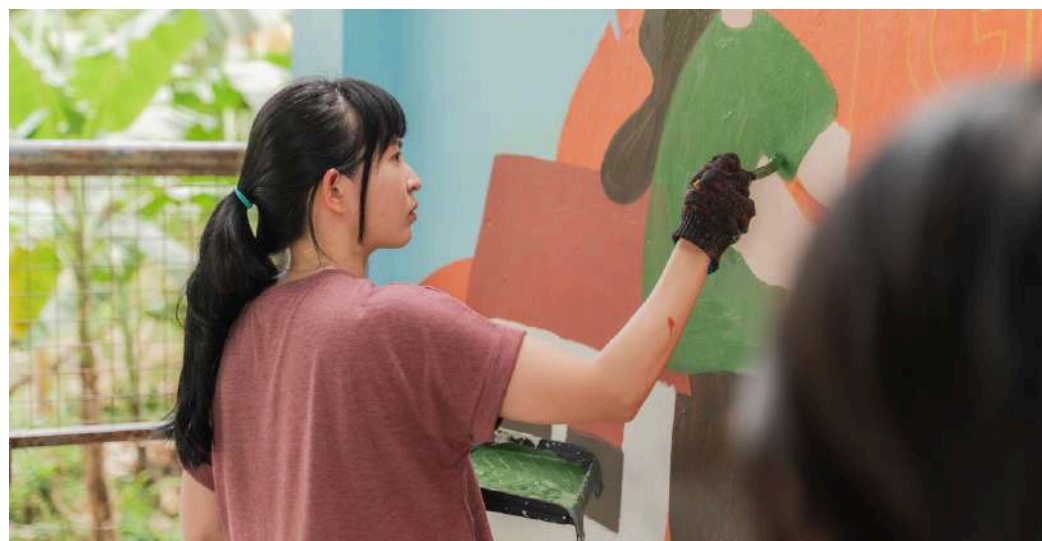
Painting | 油漆彩繪

進駐到村莊後，不代表改變就此停下！我們會透過彩繪壁畫為村莊豐富色彩，讓社區環境更加美麗，也 藉著壁畫中的意義來持續教育居民住進村莊的初衷