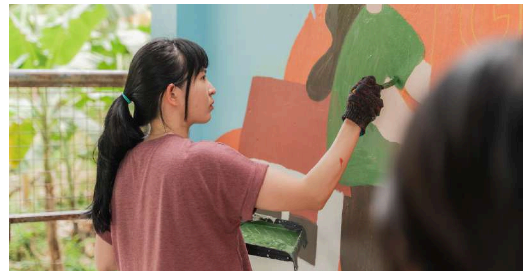
Painting | 油漆彩繪