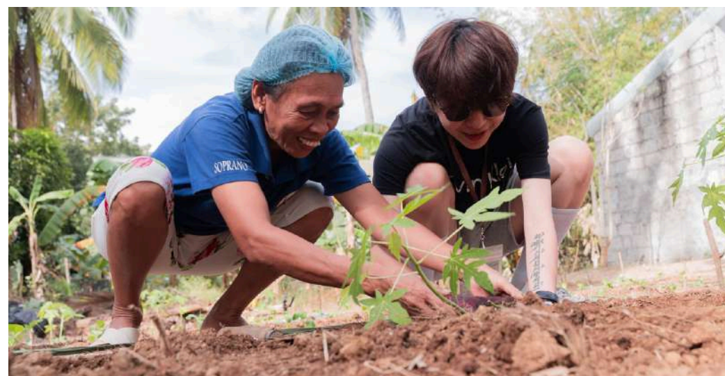
Farming | 農耕種植