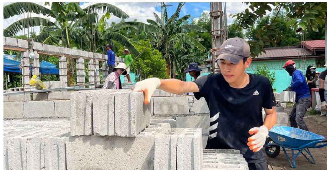
Building | 房屋建造