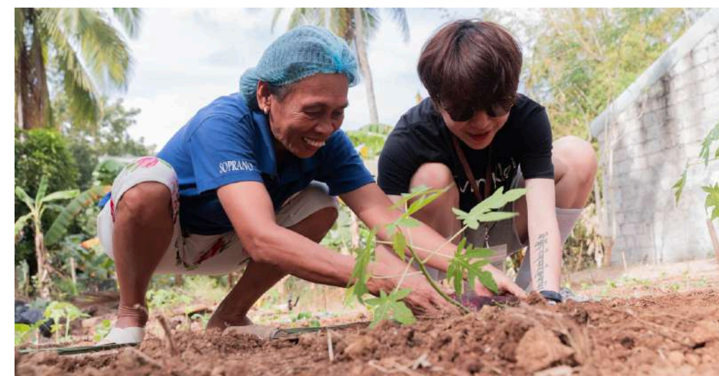
Farming | 農耕種植

在通貨膨漲的壓力下，菲律賓的蔬果都逐漸上漲，我們會協助居民進行農場建設，培養居民自給自足的能力，更學習透過農場增添生活收入、減少生活壓力