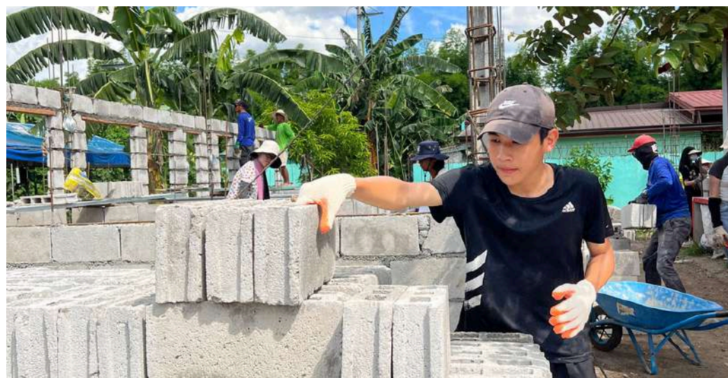
Building | 房屋建造

要住進Gawad Kalinga村莊，居民需要參與服務1600小時，因此我們將協助居民共同建造房屋，加速他們累積時數，同時讓他們能離開危險的住處、住進安全的家並翻轉貧窮！