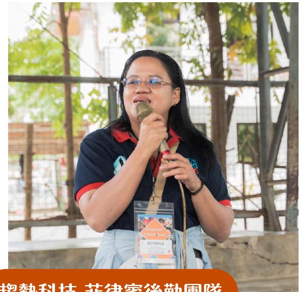
趨勢科技 菲律賓後勤團隊