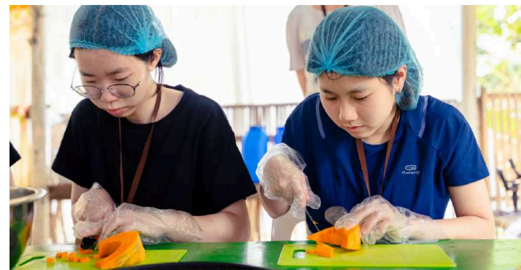
Feeding | 溫暖餐食